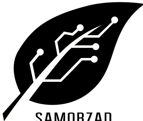
Logotyp wersja czarna, pion

SAMORZĄD STUDENCKI UNIwersytetu Przyrodniczego WE WROCŁAWIU